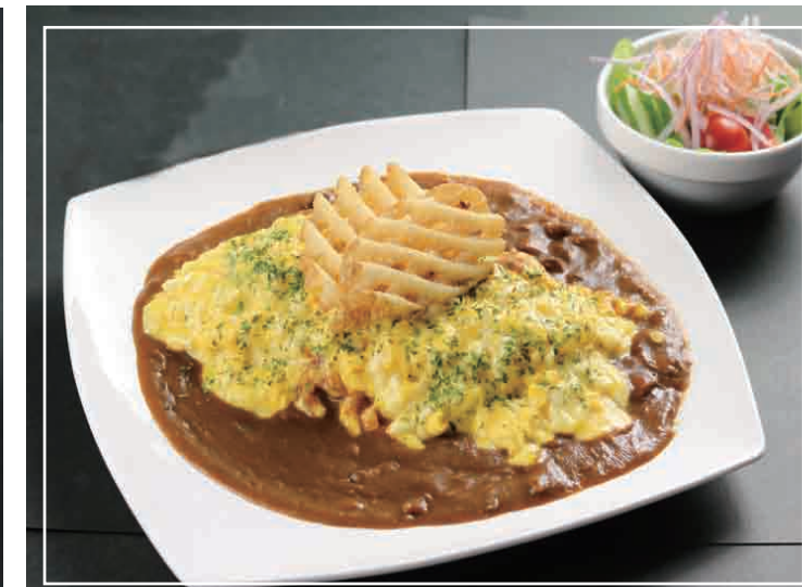
オムカレー サラダ 付き 1,000円(税込)