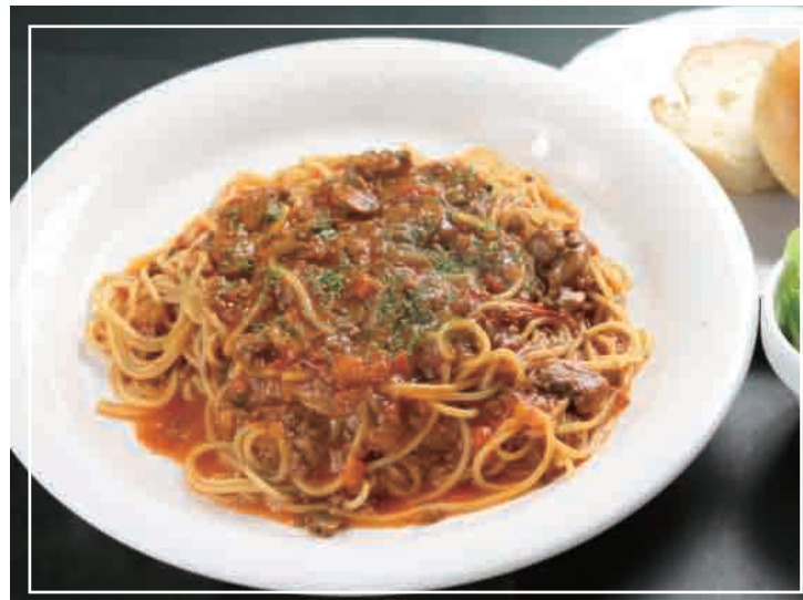
ミートソースパスタ パン・サラダ 付き 1,000円(税込)