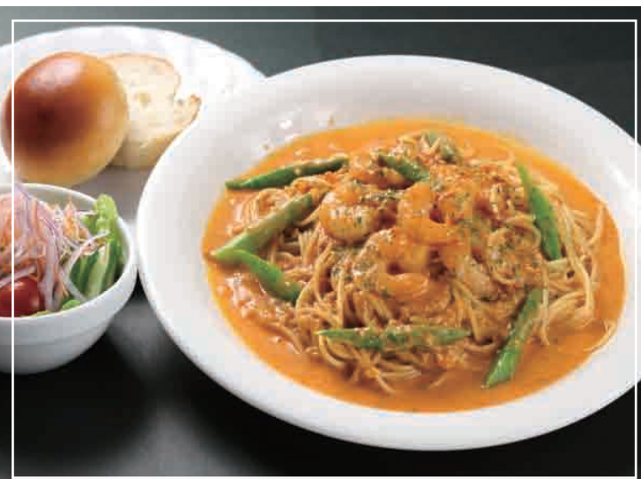
小エビのクリームパスタ パン・サラダ 付き 1,100円(税込)