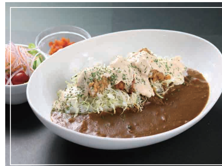
チキン南蛮カレー サラダ・福神漬 付き 1,000円(税込)