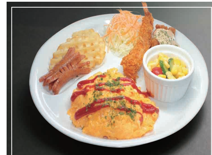
お子様ランチ オムライス・エビフライ・チキン南蛮 ソーセージ・ポテトチップ・サラダ 付き 800円(税込) ※ご注文者様がお子様のみドリンクバーが付きます