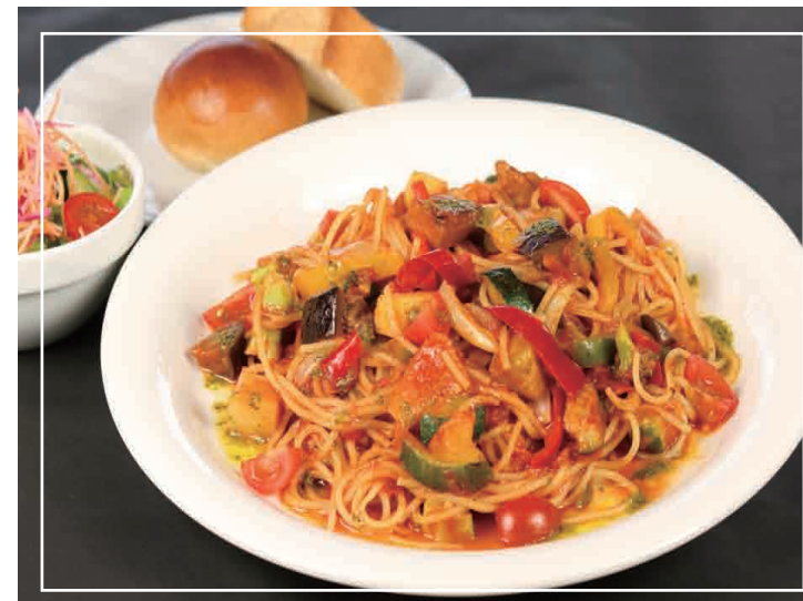
農園風トマトパスタ パン・サラダ 付き 1,100円(税込)