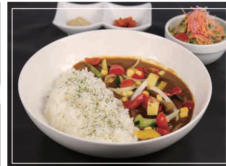
彩り野菜カレー サラダ 付き 900円(税込)