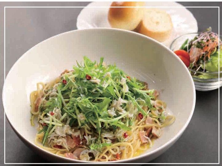
しらすとベーコンのペペロンチーノ パン・サラダ 付き 1,000円(税込)