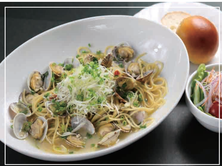
和風ボンゴレパスタ パン・サラダ 付き 1,100円(税込)