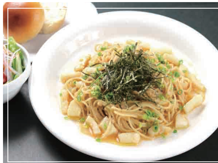
明太子とイカの Pasta パン・サラダ 付き 1,100円(税込)